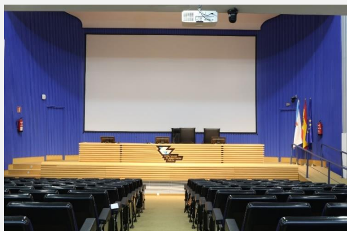
Auditorio con capacidad para 300 personas